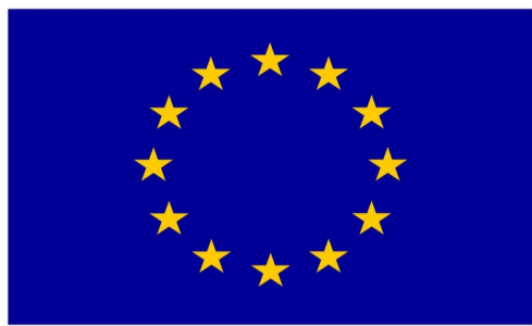
Euroopa Liit Euroopa Sotsiaalfond